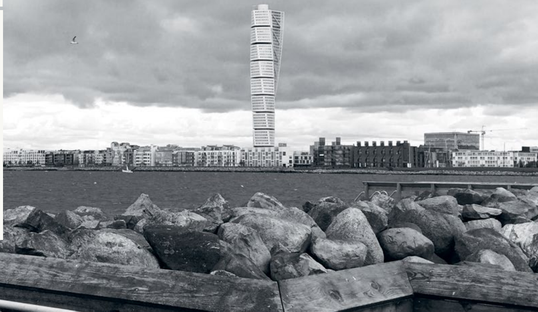
Turning Torso, Malmö